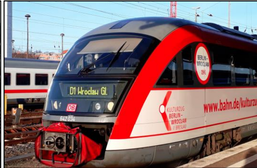
DB Regio Nordost